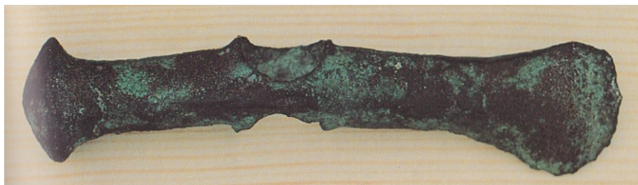
Mangekant-øks av kobber. Ca. 4100-3200 f. Kr, funnet i Oxie i Malmø, Skåne, Sverige.